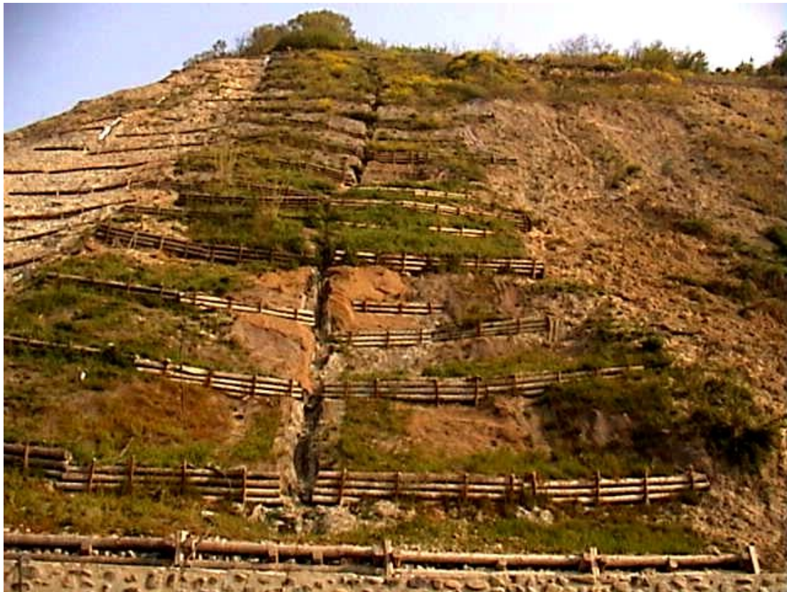
Foto 6 – Situazione dell'opera sperimentale nell'aprile 2003. Sulla sinistra sono in corso i lavori per l'ampliamento della sistemazione.