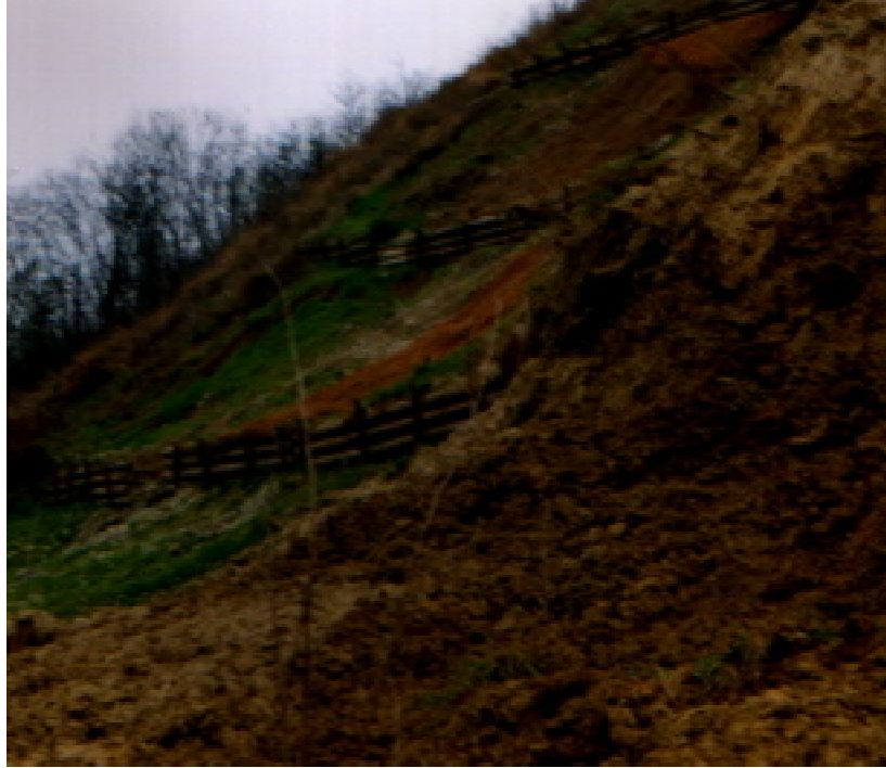
Foto 5 – Colate detritiche, verificatesi nel maggio 2002, nella zona di versante non interessata dagli interventi.