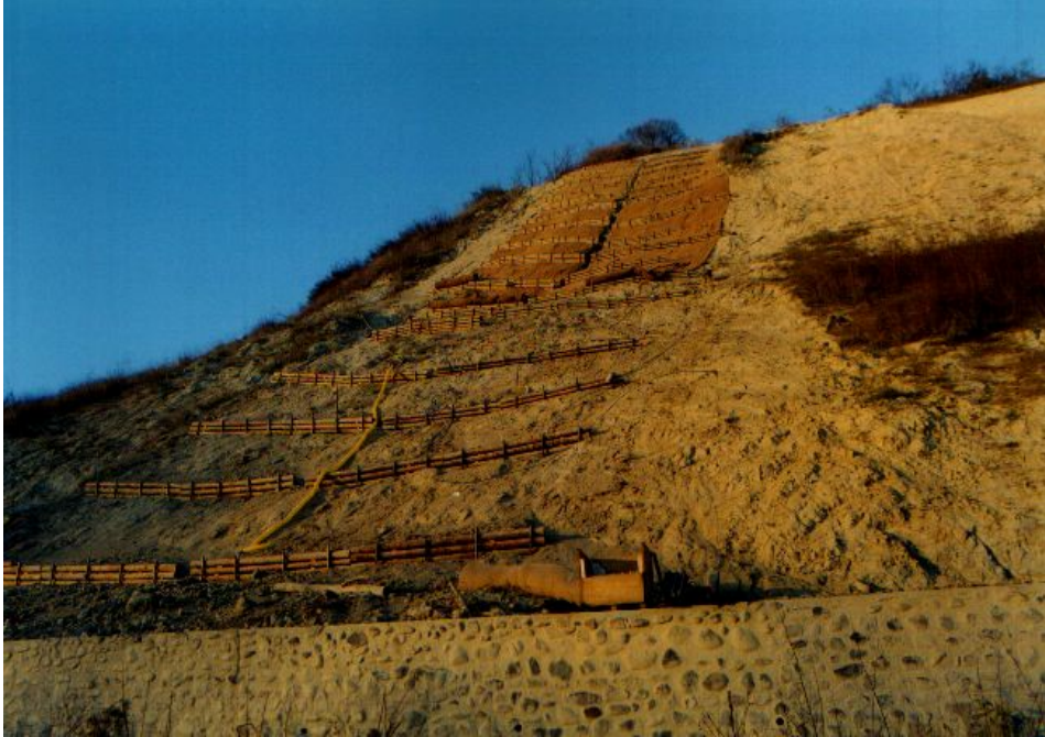
Foto 2 – Fasi della lavorazione: stesa della biostuoia in cocco. Inverno 2001.