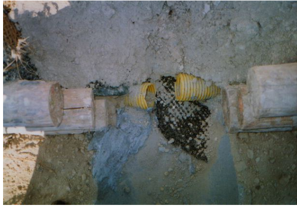
Foto 3 – Particolare dei tubi drenanti a tergo delle steconate che convogliano le acque nella canaletta centrale.