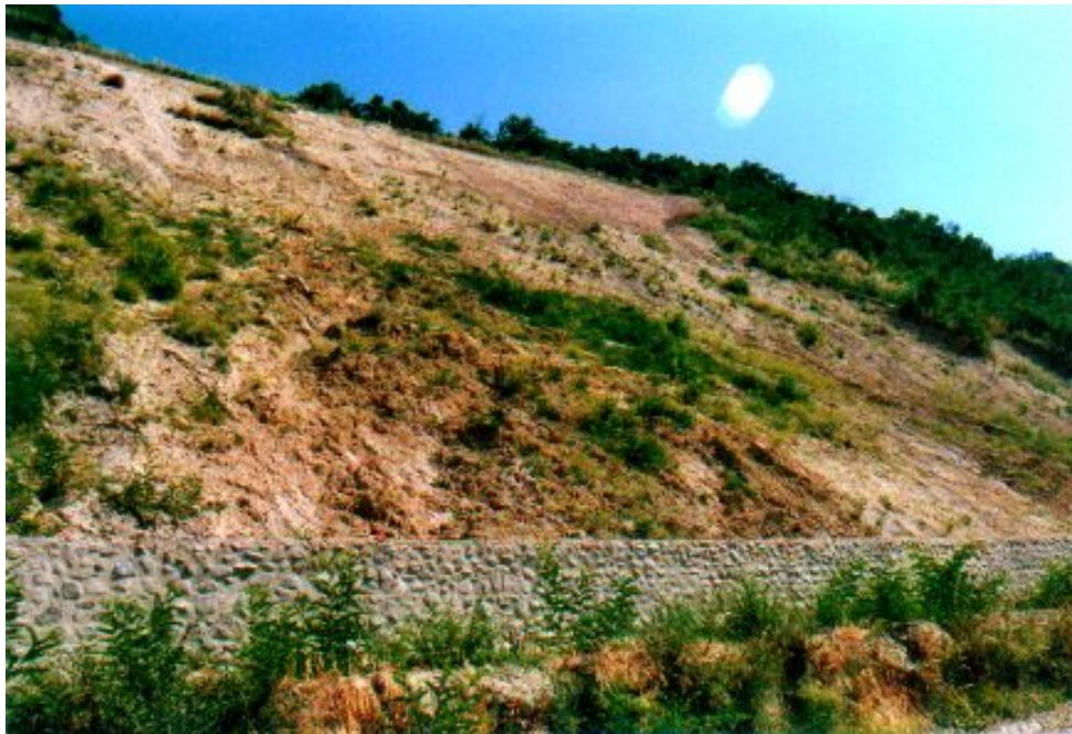
Foto 1 – Situazione del versante nell'agosto 2001. Nella zona a valle, a tergo del muro in cemento e della gabbionata, è presente un'area di accumulo del materiale franato. Il versante presenta il terreno nudo con piccole aree dove si concentra la vegetazione infestante (prevalentemente Robinia psedacacia ).